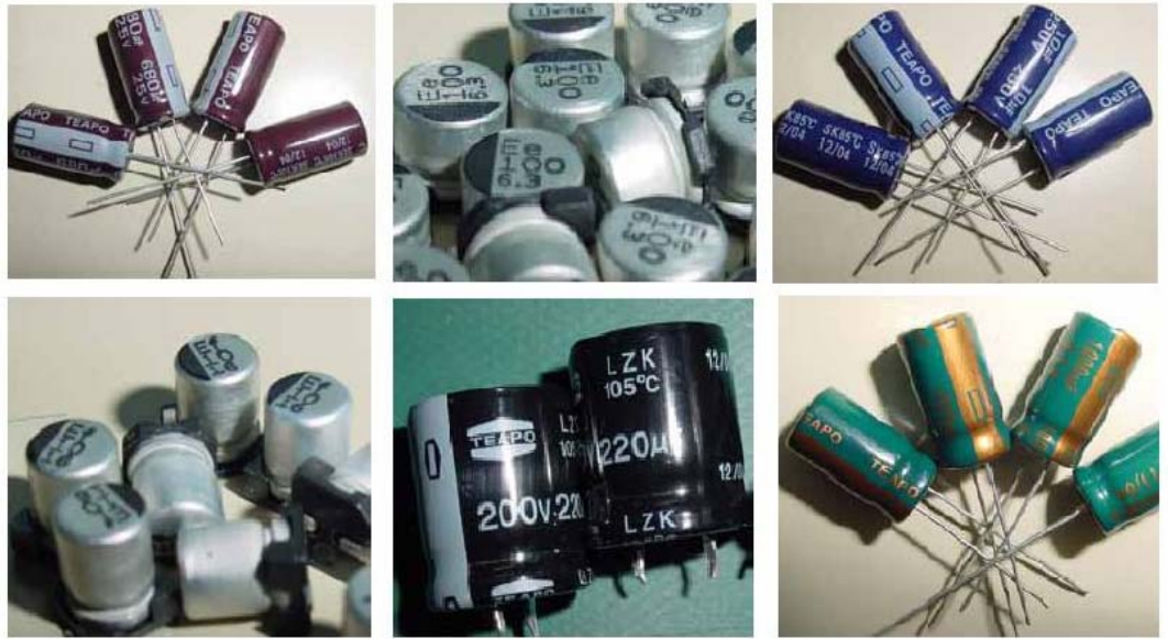
主要製品の写真と仕様